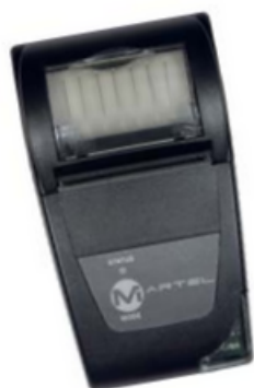
Opcional: Impresora Bluetooth (Código 5-0067)

Bluetooth® es una marca registrada de Bluetooth® SIG, Inc.