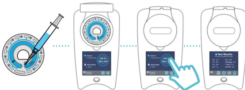
Llene el Disco

Es el sistema más avanzado jamás creado para el uso preciso de métodos de química húmeda. Ahora, los analistas pueden lograr precisión sin los largos procedimientos de prueba y limpieza. ¡Este innovador sistema de análisis es tan sencillo que cualquiera puede usarlo! ¡Sin viales que llenar, sin tiempo de preparación, sin conjeturas!